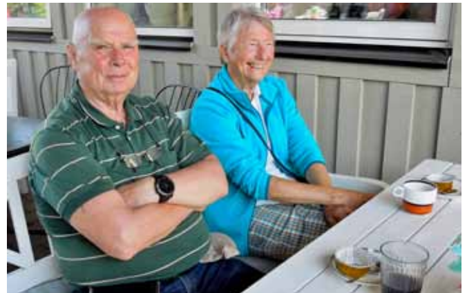
Eftermiddagsfika på Klosterbageriet i Åhus smakade förträffligt.