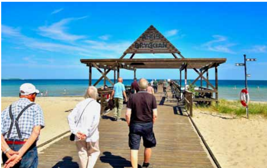
Åhusbryggan, byggd 1998, ligger på Tälletstranden och sträcker sig 120 meter ut i havet. Den består av inte mindre än 1500 plankor och är delvis finansierad med privata medel.