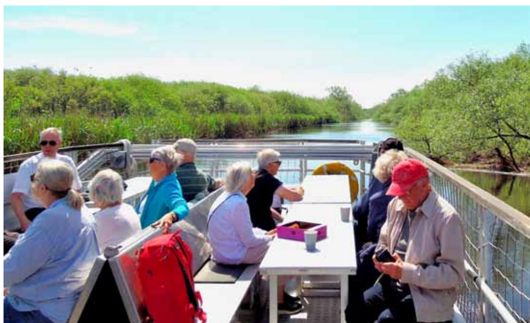
Helge å är inom Skåne 14 mil lång med en fallhöjd på 136 meter och är Skånes största vattendrag med våtmarker som hyser ett rikt fågelliv.