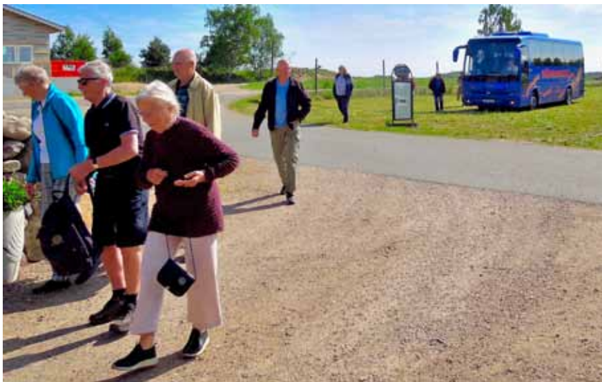
Efterlängtat fikarast på gårdscaféet Båret & Bönan i Röinge utanför Hässleholm.