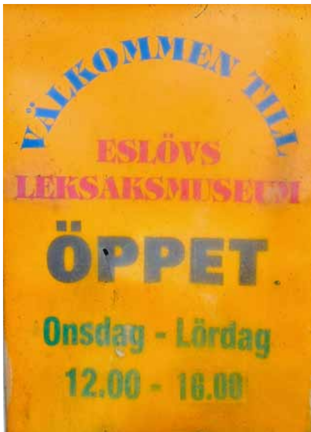
Adress: Kvarngatan 25, Eslöv – Ingång från gården.

Efter museibesöket åt vi pizza på en närliggande restaurang. Därefter åkte vi hem, vissa av oss fortfarande lite omtumlade av Leksaksmuseets rikedom på leksaker från förr och nu.