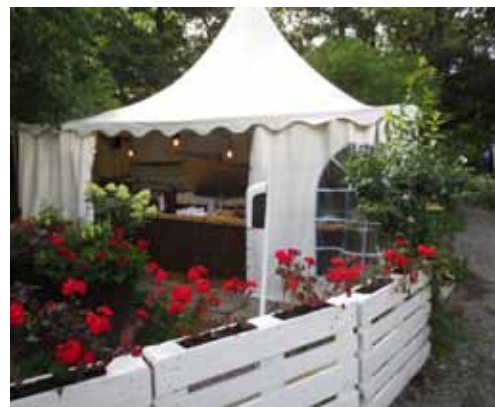
I väntan på förmiddagsfika på Gläntans BBQ , en grillrestaurang i Ystad sandskog. Man grillar själv.