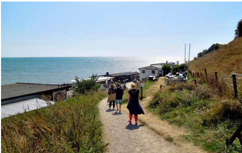
Kåseberga by ligger i Valleberga socken. Från Kåseberga leder en gångstig med brant stigning till Ales stenar, ett välbesökt turistmål.