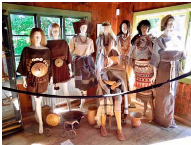
På Sågmöllan fanns också ett galleri: dockor (vuxna personer) i dräkter/klädnader från bronsåldern (2000–1000 f. Kr.). Konstnär: Andrea Neuser.