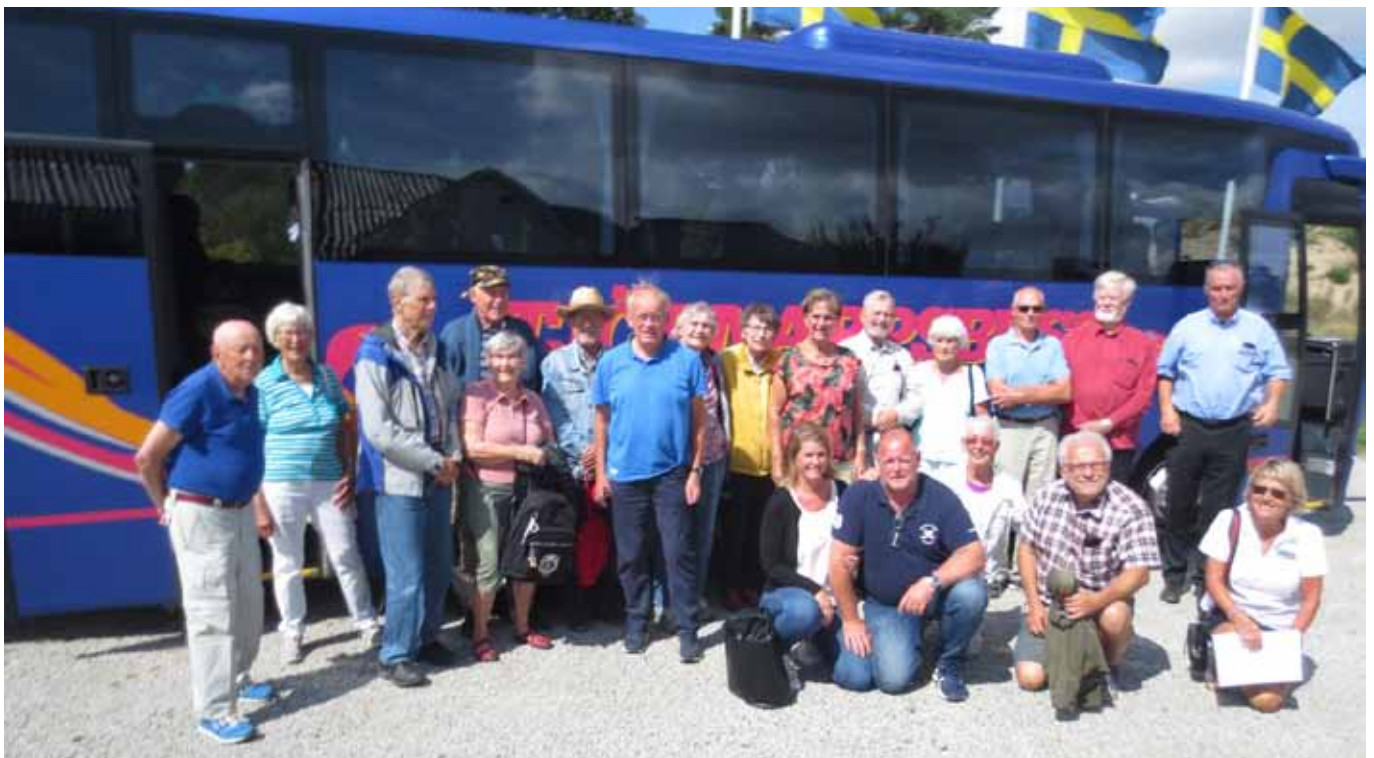
MFK på Österlenutfärd 11/8 2021