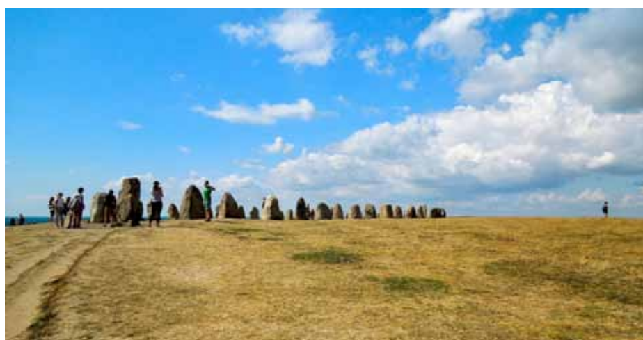
Ales stenar eller Kåsebergaskeppet är Sveriges största skeppssättning och medelst kol-14-metoden daterad till omkring 600 e. Kr. Skeppssättningen ligger på Kåsebergaåsen, 32 m över havet, och består av 59 stora stenblock som vardera väger ca fem ton. Den är 67 meter lång och 19 meter bred.