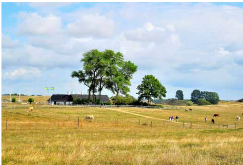
Backåkra ligger vid naturreservatet Hagestad i storslagen natur.

Text (källa: nätet): Red.