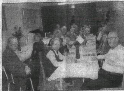
Dukat bord. Avtackningen ägde rum i Kruskahallen – vad vore väl lämpligare.